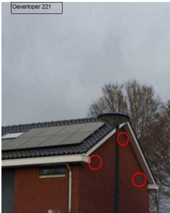
4. Situering van zowel de uitwendige als de ingebouwde of ingemetselde nestkasten (voorschrift 7 en 9).