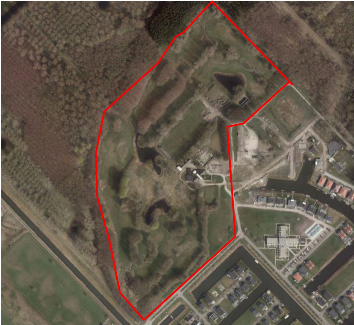
Afbeelding 2b: de situatie in 2015 waarbij opvalt dat de groenstructuren op de voormalige golfbaan robuuster zijn geworden met in rood de globale begrenzing van het plangebied.