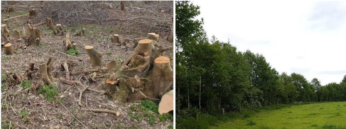
Afbeelding 6: voorbeelden van hakhoutbeheer met hakhout stoven (links) en een dichte singel waarvan jaarlijks zo'n 5-7% van de lengte wordt afgezet.

Zoomvegetaties zijn ruig, hiervan wordt jaarlijks gefaseerd een derde gemaaid. Doordat twee derde van de vegetatie lang de winter in gaat blijft voldoende dekking aanwezig voor de kleine marterachtigen.