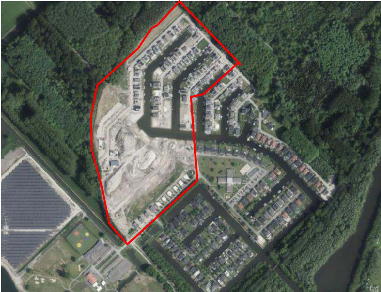
Afbeelding 2d: de situatie in het plangebied in 2023.