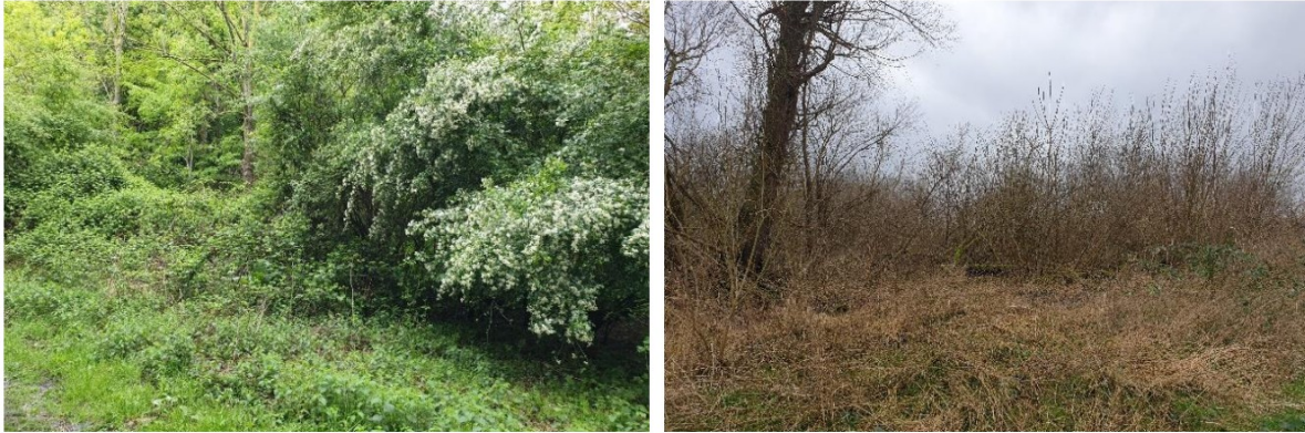
Afbeelding 6: referentiebeelden van mantel-, zoomvegetaties met soorten die van nature op kleigronden zoals in het plangebied groeien.