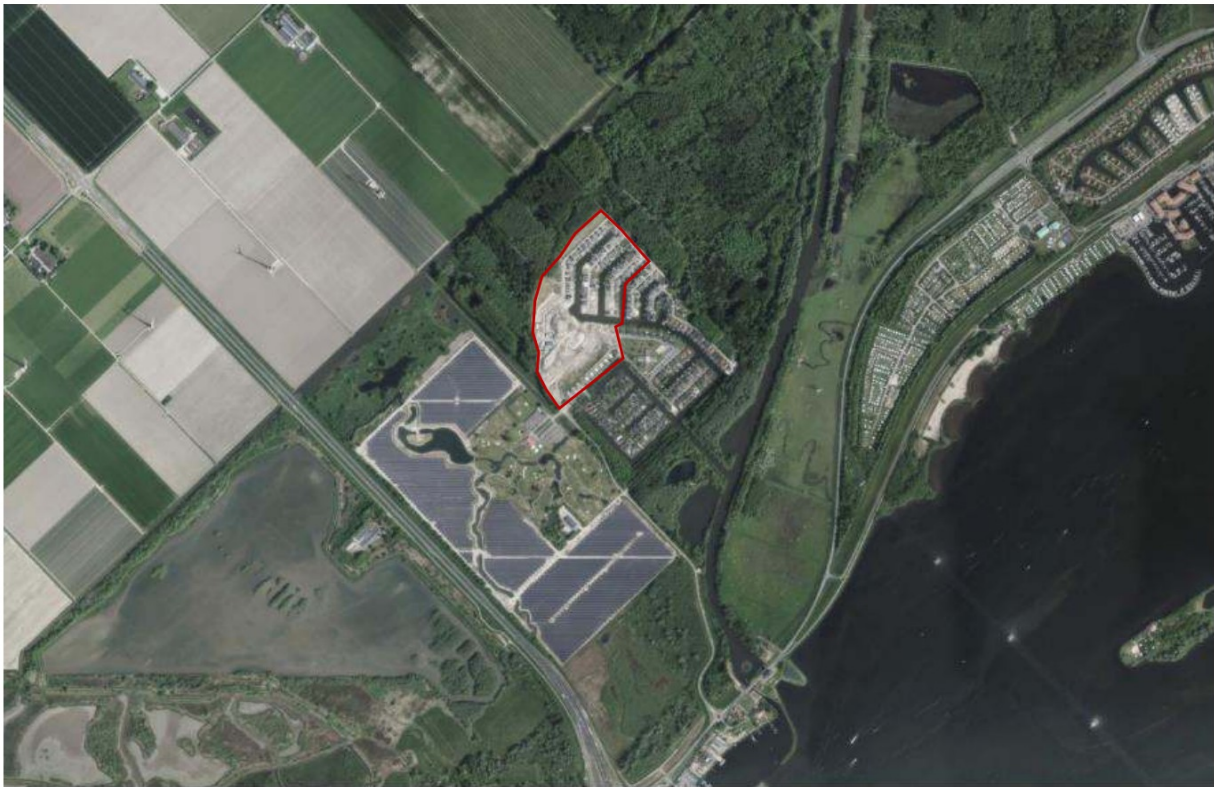
Afbeelding 1. Ligging en begrenzing van het plangebied, weergegeven met rode omlijning.

Rondom het plangebied ligt een bosgebied en de reeds gerealiseerde villawijk.