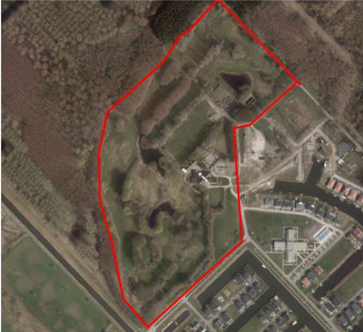
Afbeelding 2a: de situatie in het plangebied voor de start van de ontwikkelingen in het noordwestelijk deel.