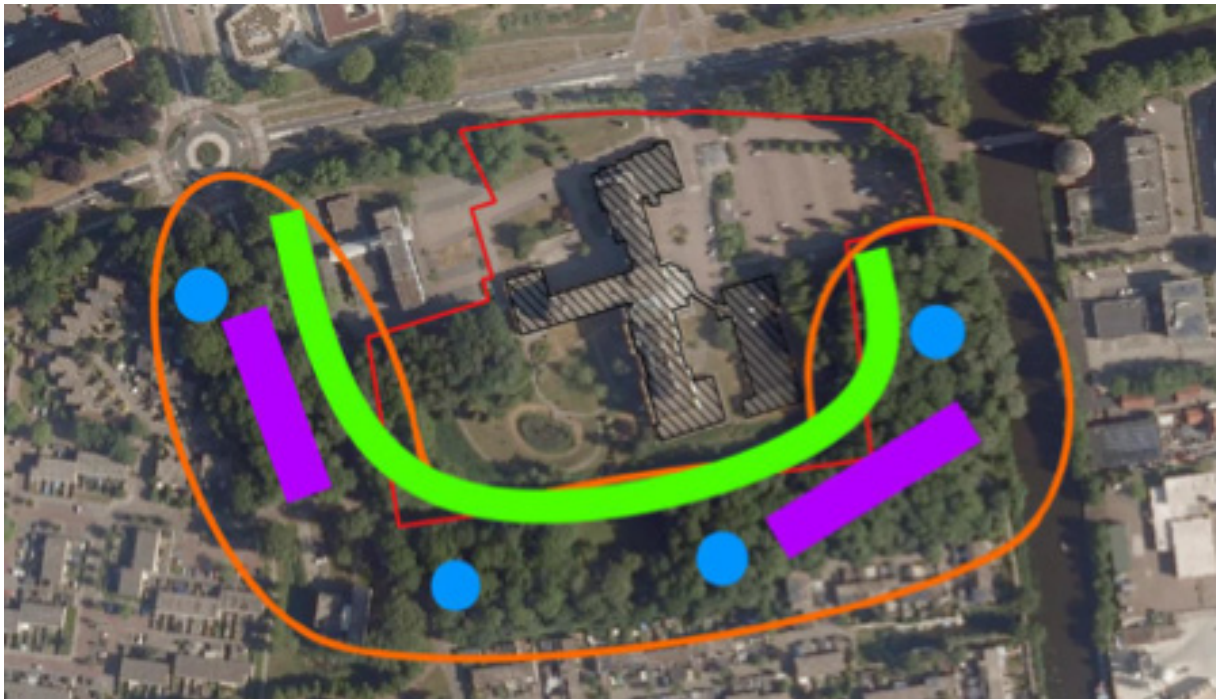
Globale impressie hoe het bosachtige gebied ten zuiden en westen van het plangebied (oranje) geschikt wordt gemaakt voor wezel en bunzing. Paars = takkenrillen, blauw = takkenhopen, groen = mantel-zoom vegetatie