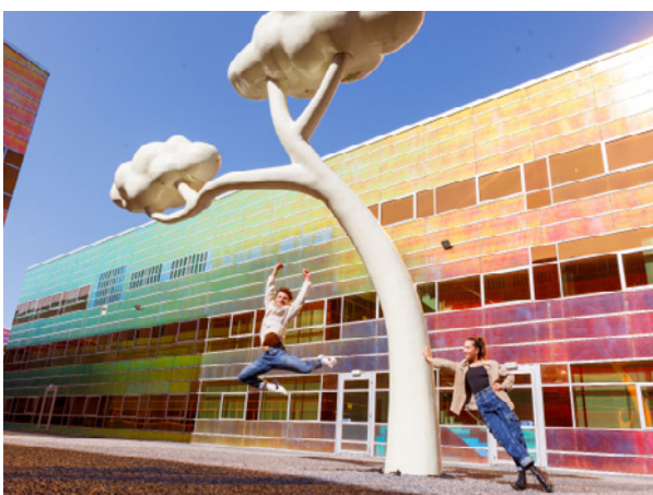
Foto: Kunstwerk Where thoughts are door Ram Katzir

Cultuur maakt ons tot wie wij zijn en tot wat wij zijn als stad. Vanuit deze visie werkt Almere aan een aantrekkelijk en toegankelijk cultureel aanbod, zodat iedereen dit dat wil kan meedoen aan het culturele leven. Onze trots zijn de organisaties die Almeerse kinderen vanaf jonge leeftijd enthousiast maken voor kunst, zoals 2turvenhoog, BonteHond, Kleur in Cultuur, CKV Almere, het AJSO en vele andere aanbieders van culturele activiteiten. Met het oog op de gezonde en duurzame groei van Almere, waarbij sociale opgaven evenveel aandacht krijgen als fysieke opgaven, zorgen wij ervoor dat de cultuursector meegroeit met het aantal inwoners. Dit betekent onder andere: meer ruimte voor The Culture, extra broedplaatsen voor makers, en een intensiever gebruik van de stad als podium. Van dit laatste is het lichtfestival ALLUMINOUS een aansprekend voorbeeld. Via StrandLAB en Flevolab werken wij aan vernieuwing en verbreding van cultuur en aan een hechter regionaal cultureel netwerk. De bijzondere geschiedenis van Almere en ons erfgoed – in de grond en boven de grond – geven vorm aan de identiteit van Almere. Dit geldt ook voor onze bijzondere architectuur, de landschapskunst en allerlei nieuwe initiatieven op het snijvlak van urban sports & culture. Talenten uit eigen stad laten zien dat cultuur in Almere bloeit.