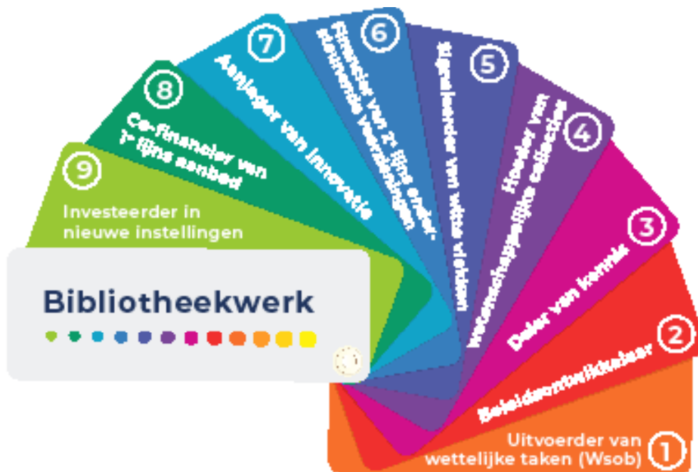
Figuur 2. Waaier met provinciale rollen op het terrein van bibliotheekwerk (ontwikkeld door adviesbureau Berenschot).