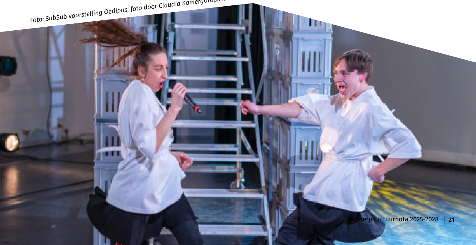
Foto: SubSub voorstelling Oedipus