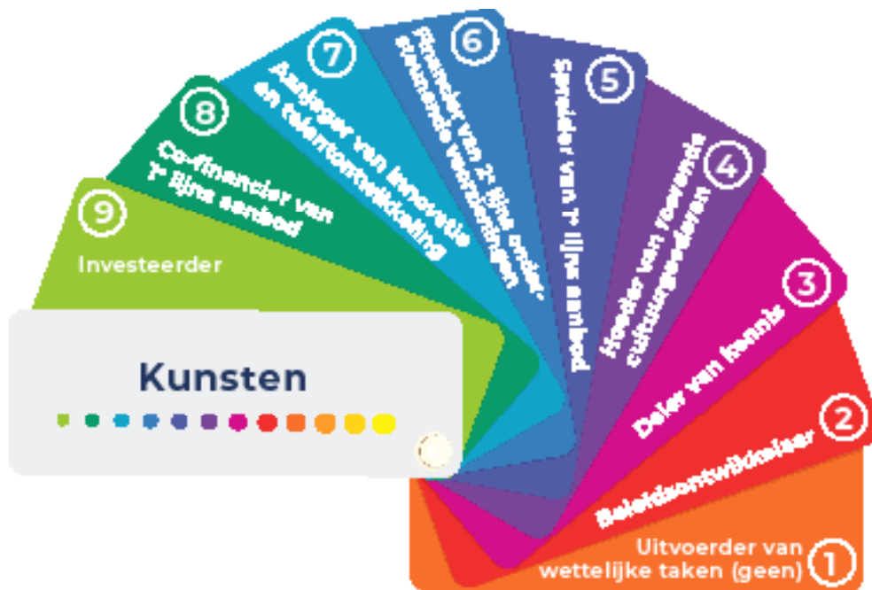
Figuur 1. Waaier met provinciale rollen op het terrein van de kunsten (ontwikkeld door adviesbureau Berenschot).