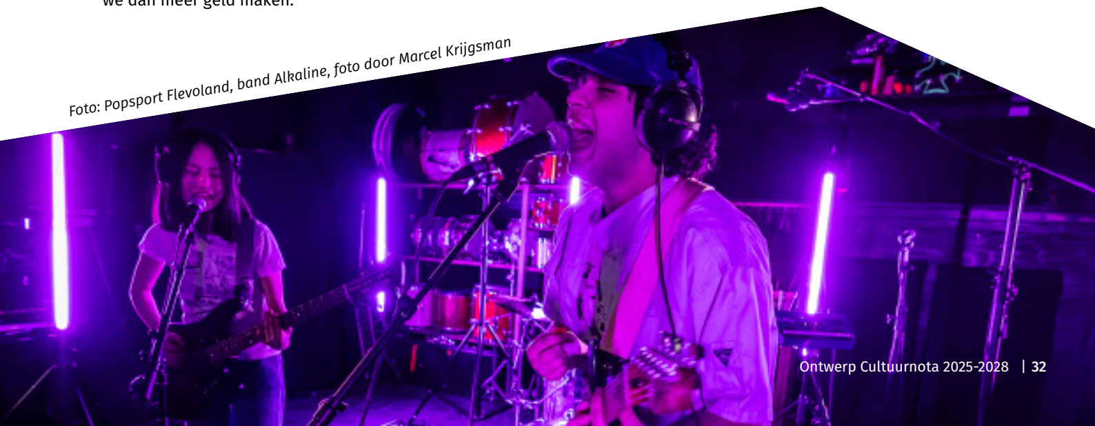
Foto: Popsport Flevoland, band Alkaline, foto door Marcel Krijgsman

Hierbij is alleen sprake van uitbreiding van de wettelijke taak van de provincie op het gebied van bibliotheken. Daarnaast wordt bij professionele podiumkunst het budget geactualiseerd in lijn met de groei van de bevolking. Met dit scenario blijft Flevoland flink achterlopen op cultureel gebied.