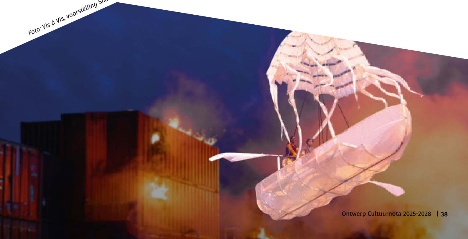
voorstelling Silo 8

Voormalig staatssecretaris mw. Uslu heeft in haar Meerjarenbrief 2025-2028 aangegeven duidelijke meerwaarde in de cultuurregio's te zien, de samenwerking te willen voortzetten en daarbij blijvend aandacht te geven aan onderwerpen waarop het rijk en de andere overheden elkaar versterken.