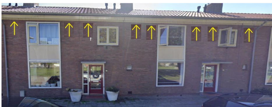
Standaard gierzwaluwkast, schuin afgetimmerd

1. Woningen waar nesten van gierzwaluw, huismus en spreeuw aangetroffen zijn (voorschrift 7).