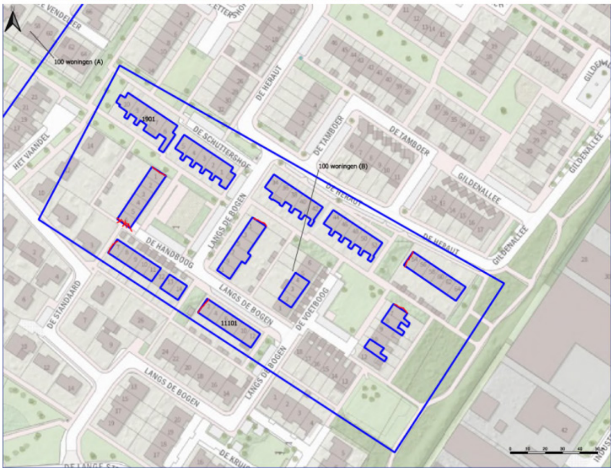
Figuur 2: Te realiseren permanente nestplaatsen van gierzwaluwen. Ter plaatse van de zeven kopgevels worden in totaal 45 kustnesten bevestigd zoals onderstaand in figuur 6 als voorbeeld aangegeven.

4. In deelgebied B worden voor de gierzwaluw aan 6 kopgevels 7 enkele permanente nestkasten ingebouwd, op de locaties: De Handboog 1, en 7, De Voetboog 7, Langs de Bogen 1, 2 en De Heraut 54. En aan 1 kopgevel 3 enkele nestkasten op de locatie De Handboog 6 te Swifterbant.