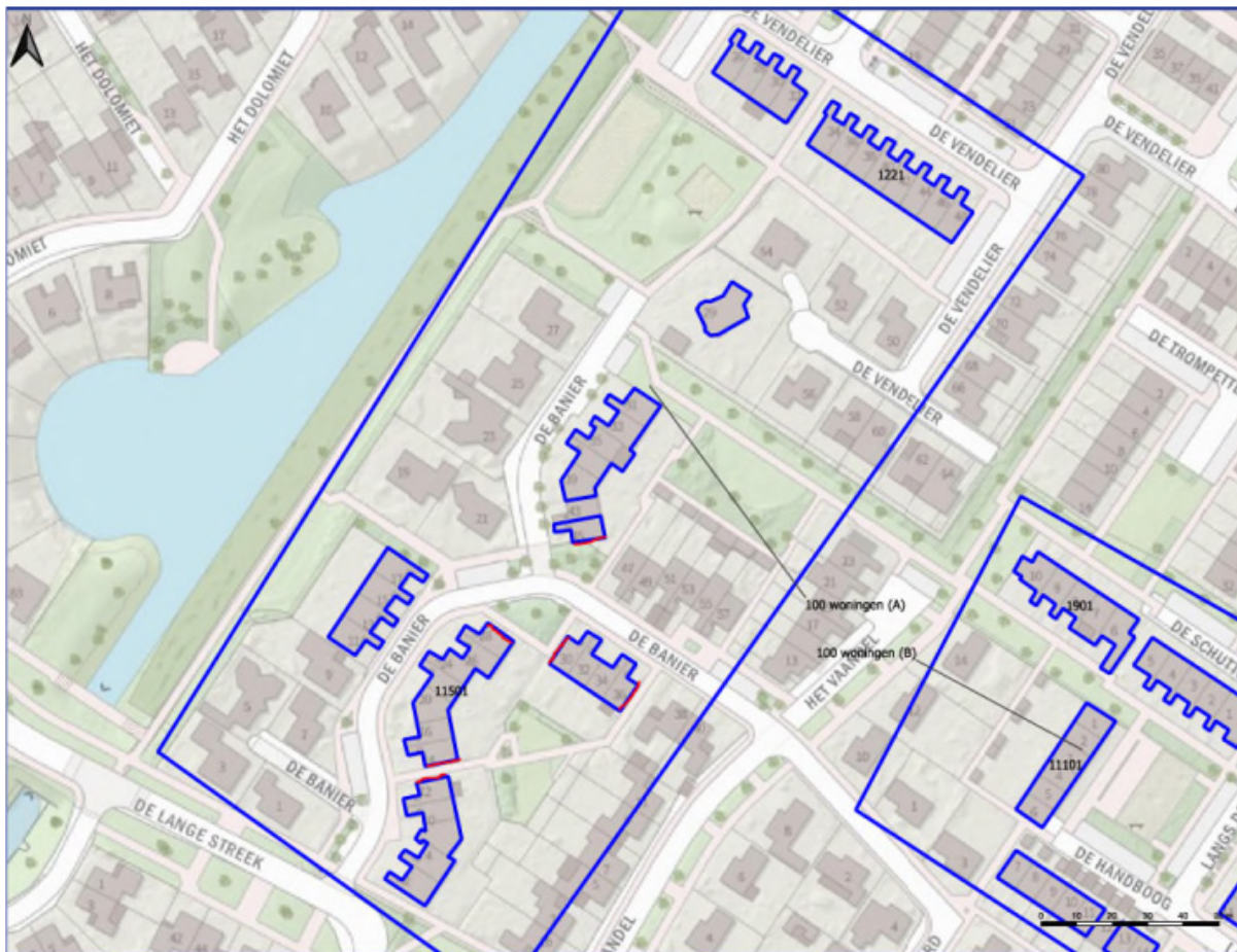
Figuur 1: Te realiseren permanente nestplaatsen van gierzwaluwen. Ter plaatse van de zes kopgevels worden in totaal 30 nestkasten ingemetseld zoals onderstaand in figuur 5 als voorbeeld aangegeven.

3. In deelgebied A worden voor de gierzwaluw aan 6 kopgevels elk 5 enkele permanente nestkasten ingebouwd op de locaties: De Banier 12, 14, 28, 30, 36 & 45 te Swifterbant.