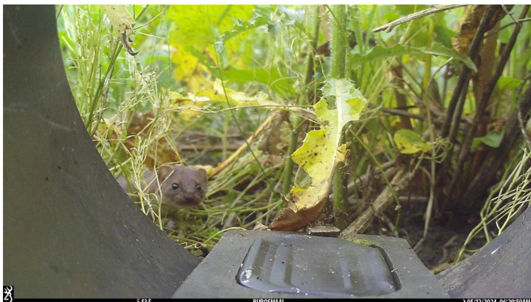
Waarneming wezel met behulp van Struikrover® op 12 mei 2024