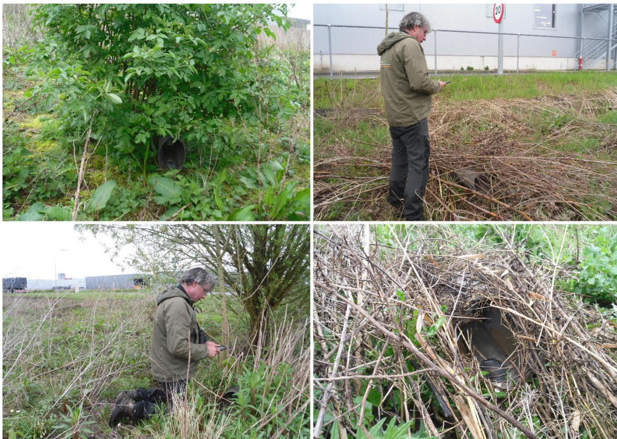
Impressie van (het plaatsen van) de cameravallen.