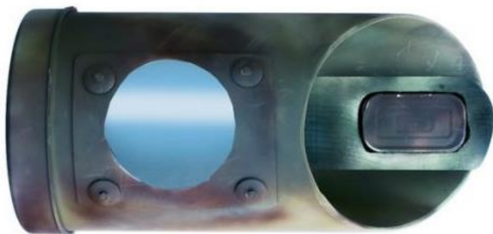
Afbeelding van een Struikrover® (bovenaanzicht)

Onderzoeksmethode: Voor het acht weken durende onderzoek wordt gebruik gemaakt van de Struikrover®. De Struikrover® is een cameraval die voor dit doel door de Zoogdierverseniging als bewezen effectief inzetbaar is omschreven.