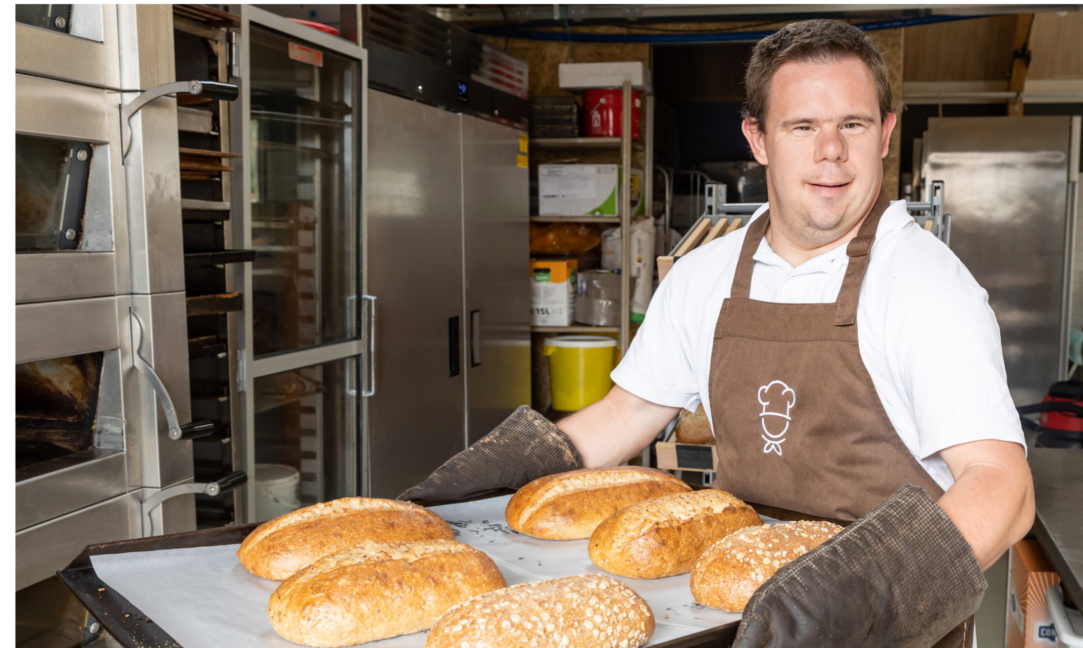
↑ Een deelnemer in de zorgbakkerij.

Onze ambitie: een CO 2 -neutraal Flevoland in 2050.