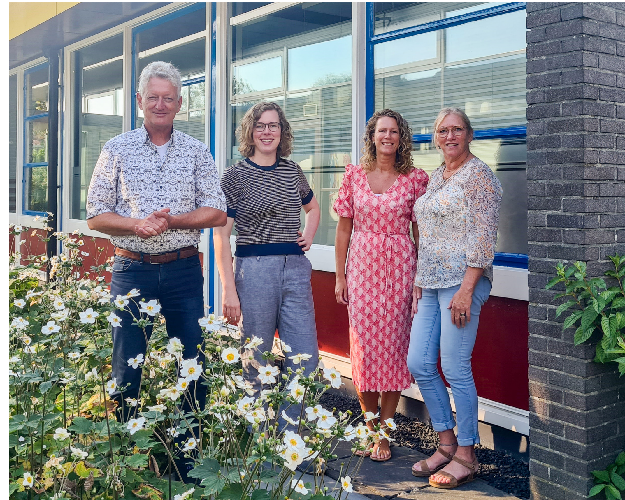
↑ Team Huisartsenpraktijk Swifterbant

Met een lage gasprijs was de terugverdiendtijd ruim 7 jaar. Met een hoge gasprijs is de terugverdiendtijd 1,9 jaar.