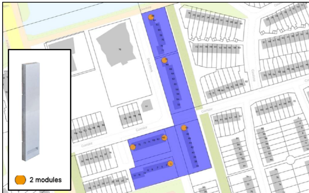
Figuur 1. Vleermuisvoorzieningen complex 25. Adressen: Doorsteek 50, 70, 86, Groene Kamer 1, Corridor 65 en 77.