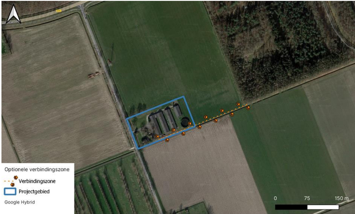
Ruigtebegroeiing tussen plangebied en Waterloopbos