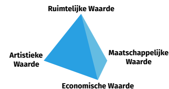
Afbeelding 1: Culturele waardemodel, Berenschot

In de cultuurperiode 2021-2024 willen we met ons beleid deze vier waarden versterken. We werken aan een sterk cultureel klimaat van hoge artistieke waarde, waarvan maker en publiek, maatschappij, economie en ruimtelijke omgeving profiteren.