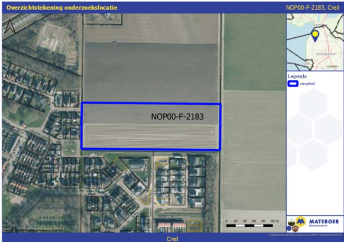
Figuur 1: Ligging van het plangebied (binnen de blauwe belijning).