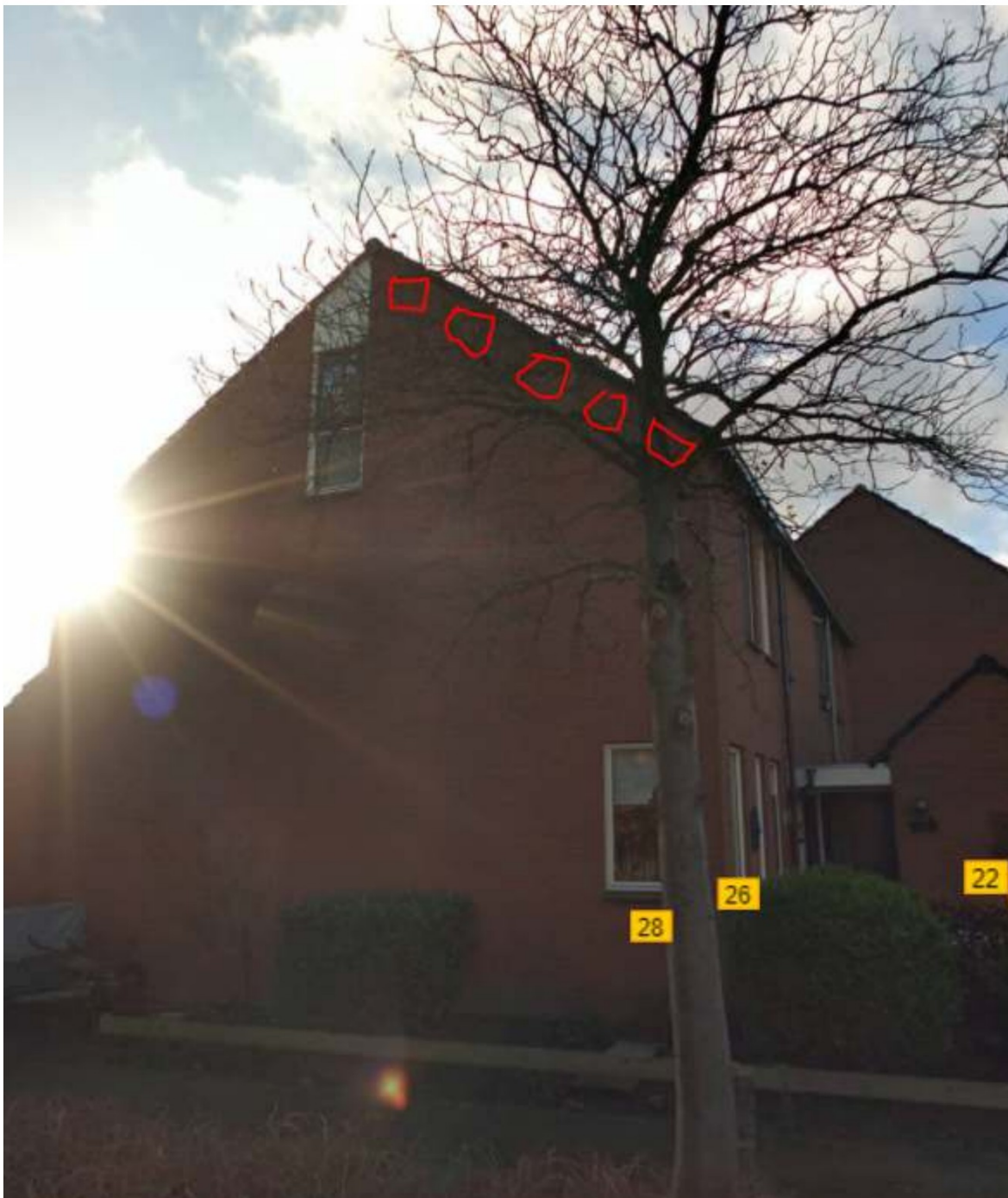
Figuur 5: voorbeeld van de te realiseren permanente nestplaatsen van gierzwaluwen (rood)