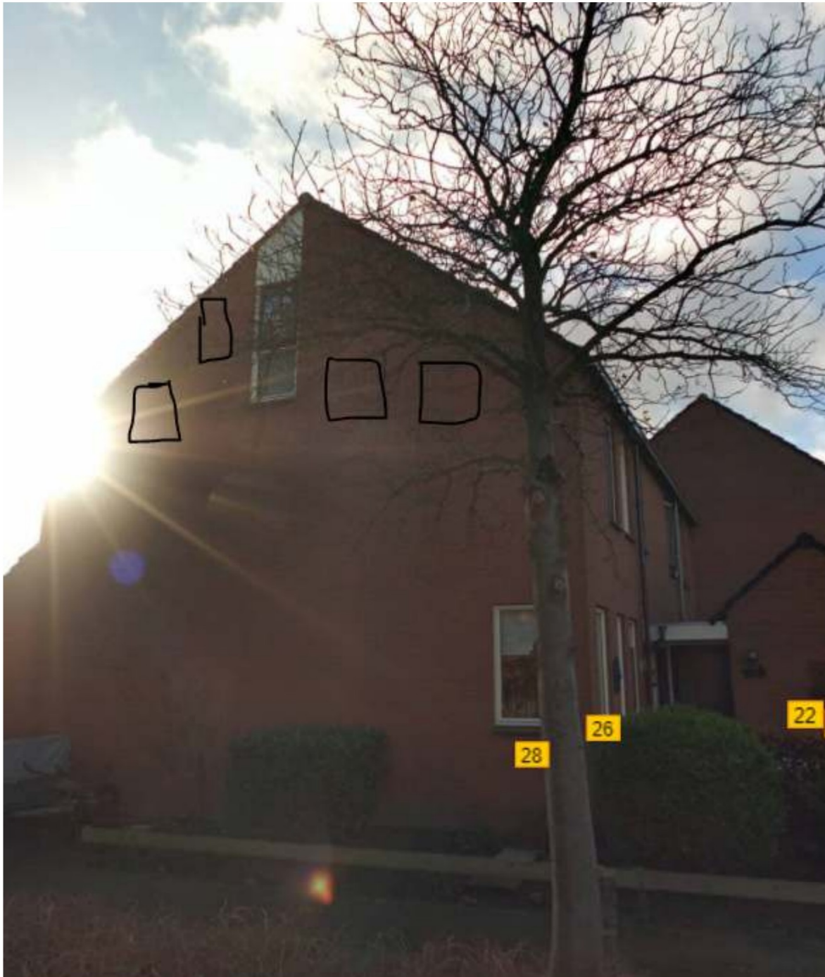
Figuur 7: voorbeeld van de te realiseren permanente verblijfplaatsen van vleermuizen (zwart)