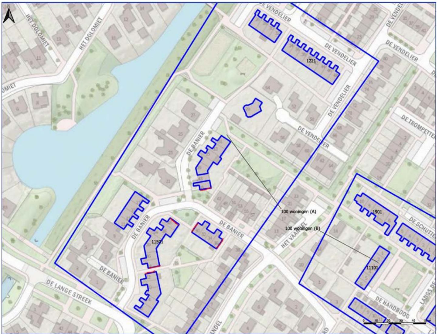
Figuur 1: Te realiseren permanente nestplaatsen van gierzwaluwen. Ter plaatse van de zes kopgevels worden in totaal 30 nestkasten ingemetseld zoals onderstaand in figuur 5 als voorbeeld aangegeven.