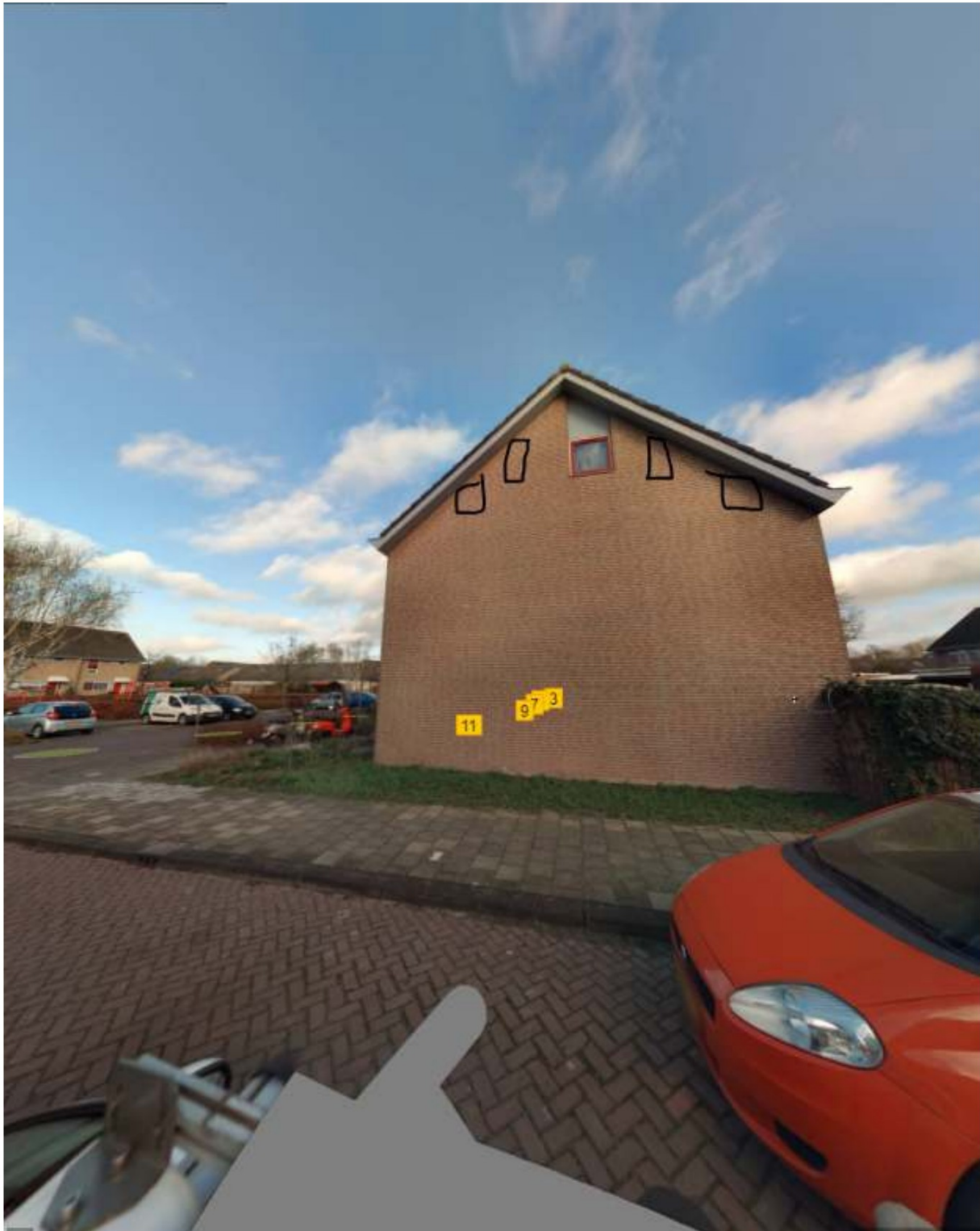
Figuur 8: voorbeeld van de te realiseren permanente verblijfplaatsen van vleermuizen (zwart)