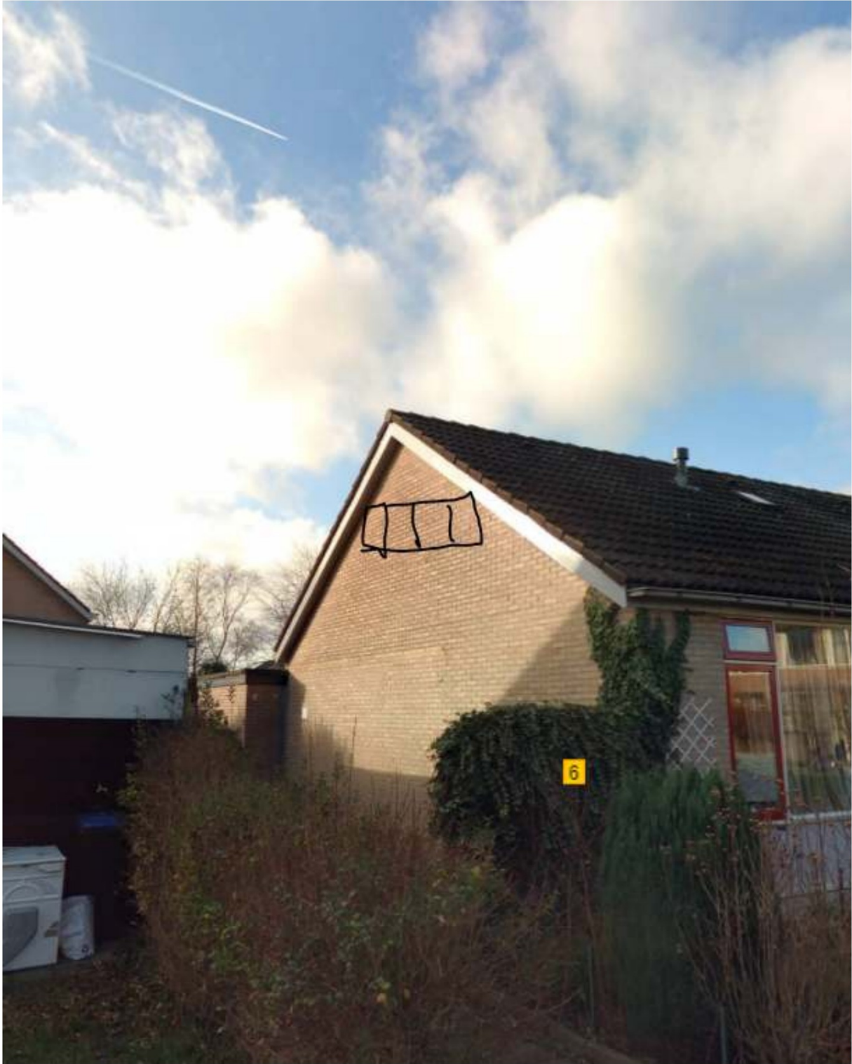
Figuur 9: voorbeeld van de te realiseren permanente verblijfplaatsen van vleermuizen (zwart)