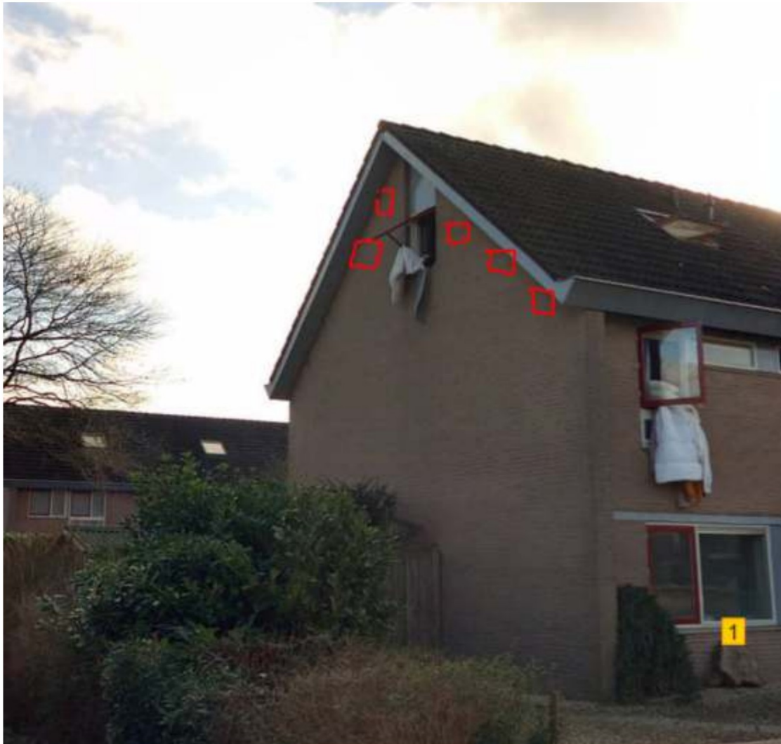
Figuur 6 voorbeeld van de te realiseren permanente nestplaatsen van gierzwaluwen (rood)