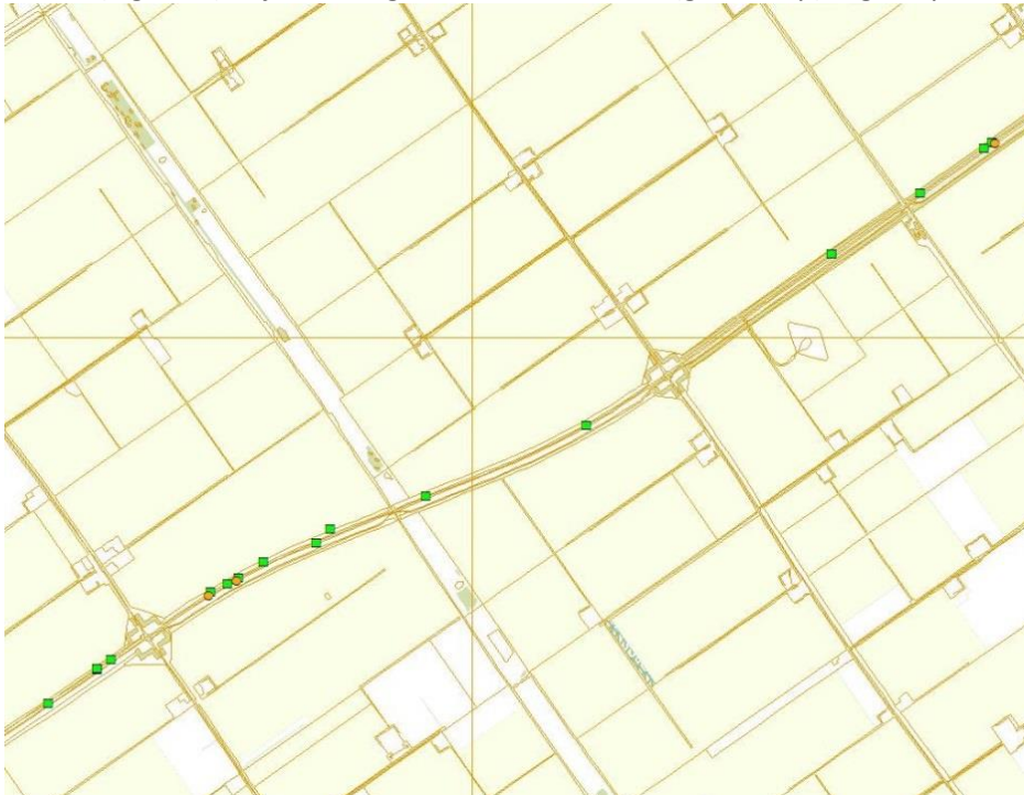
Figuur 1 bomen met holtes en paarverblijven

Paarverblijven van gewone dwergvleermuis zijn vastgesteld bij 3 bomen (gele stip op kaartje) met holten (Figuur 1). Bij de overige bomen met holtes (groen stip) is geen paaractiviteit vastgesteld.